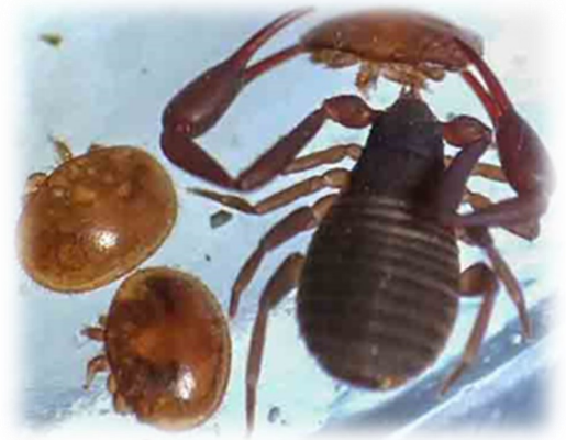
Chelifer cancellatorius attrapant un varroa

Lorsqu'on les observe au microscope, on les voit s'approcher rapidement des varroas, les attraper avec leur grande pince et les paralyser avec du poison.