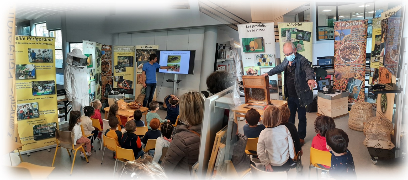
Intervention de l'Abeille Périgordine auprès de classes de primaire et de maternelle à la médiathèque de Périgueux dans le cadre de la semaine du développement durable organisée par la ville de Périgueux