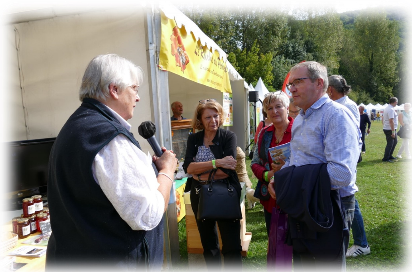
Madame la Présidente de l'Abeille Périgordine et Monsieur le Président du Conseil Départemental

L'Abeille Périgordine était invitée le 25 septembre à Castelnau-La-Chapelle pour la foire du Gabarier organisée par le Conseil Départemental dans le cadre de la semaine du développement durable. De nombreux exposants étaient réunis pour intervenir sur les thèmes de l'environnement, de l'eau et du climat.