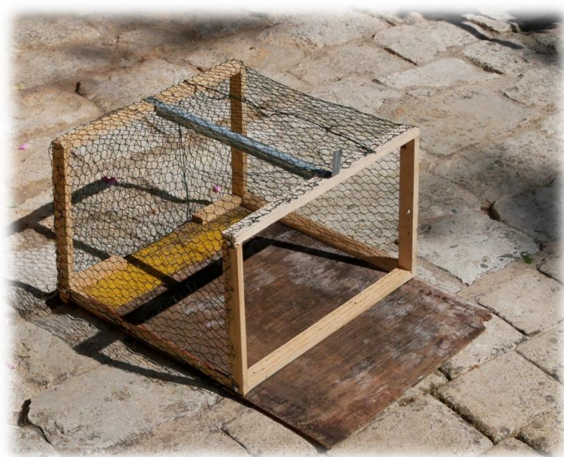
Cage anti frelon

-La cage-filtre est constituée d'un grillage à maille relativement fine (de l'ordre du centimètre) installé sur un bâti léger situé à quelques décimètres devant l'entrée des ruches. Il est franchi aisément par les abeilles qui ont le temps de prendre de la vitesse pour échapper à leurs ravisseurs et maintient les frelons à distance de la ruche. Il en existe divers modèles mais il peut être construit par l'apiculteur. Celui que nous avons fabriqué se pose et se dépose d'un seul geste et ne nécessite aucun aménagement sur la ruche. Nous l'expérimenterons cet automne.