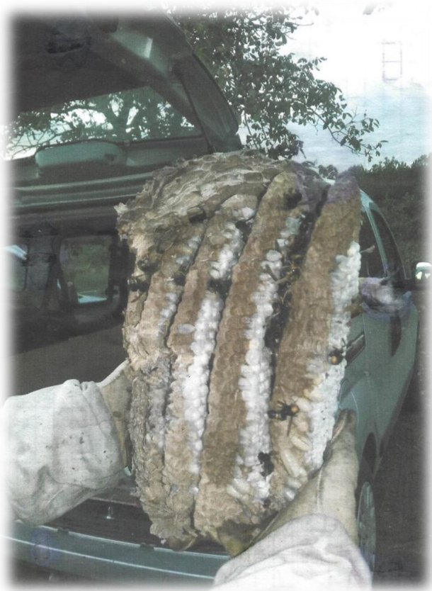
Nid en cours de destruction

Dans ces conditions, toutes les actions susceptibles de réduire les populations de frelon asiatique sans nuire à l'environnement doivent être mises en oeuvre :