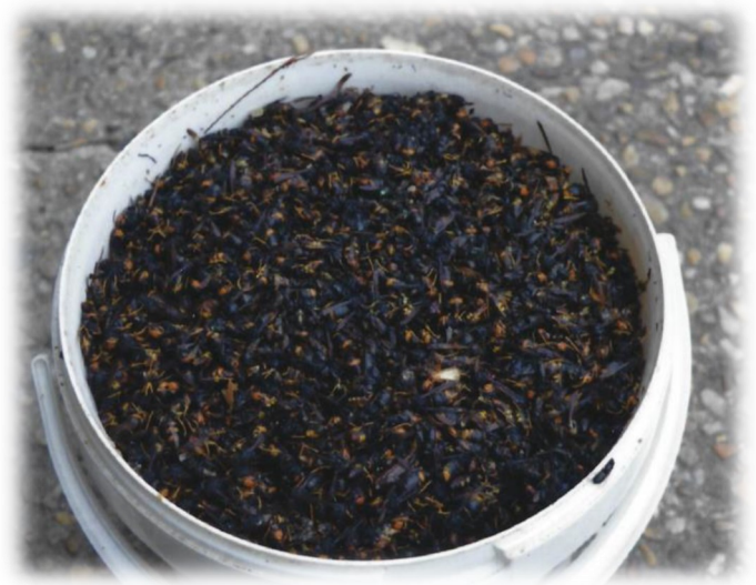
Les captures de l'automne 2019