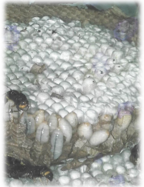
Nid en activité