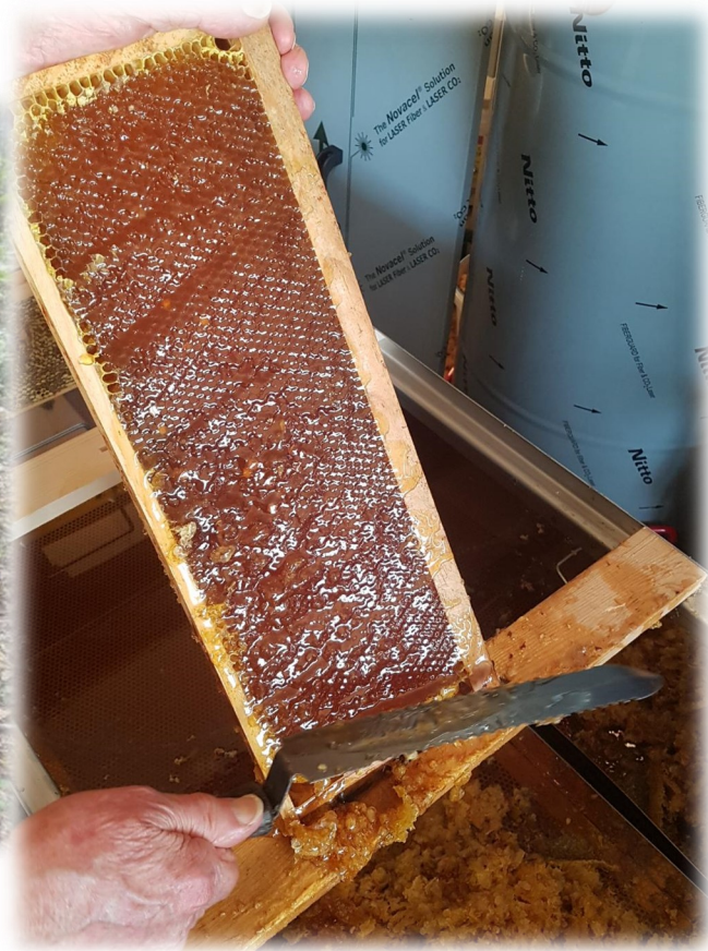
Cadre désoperculé pendant l'extraction