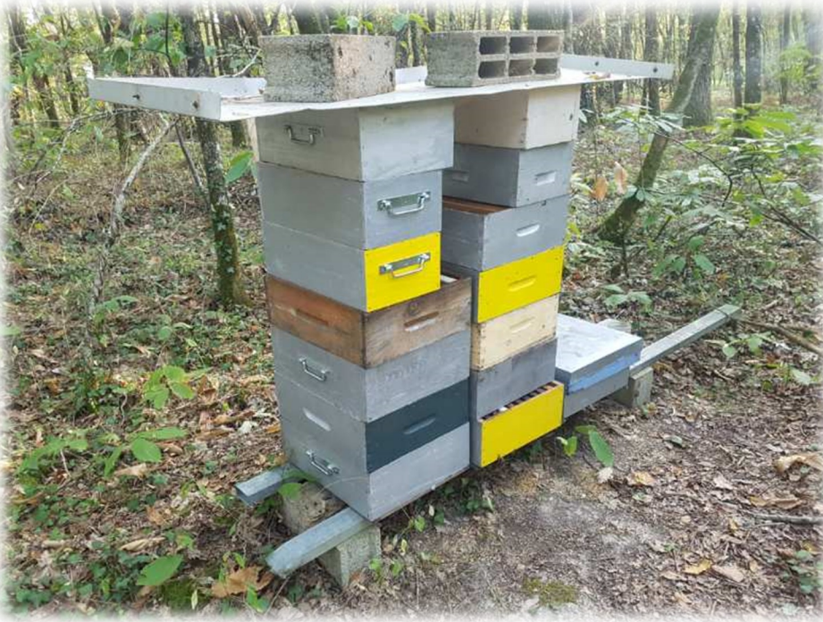
Piles de hausses en cours de nettoyage par les abeilles