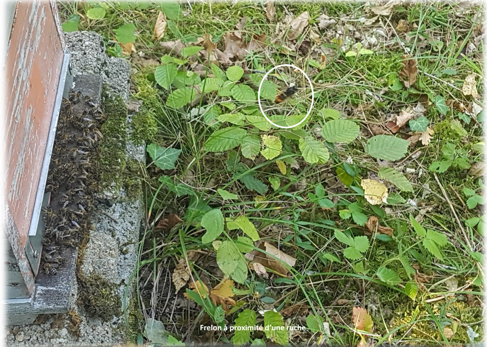
Frelon à proximité d'une ruche