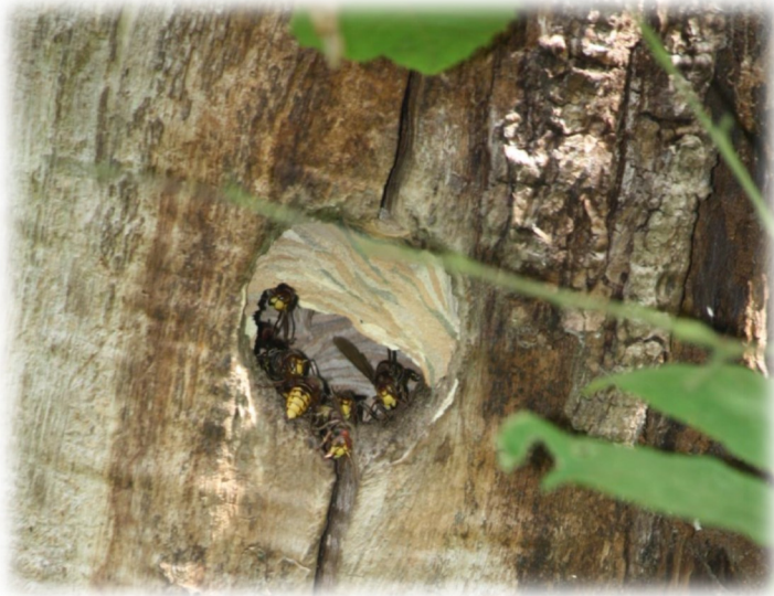
Nid de frelon européen dans un arbre creux