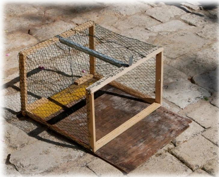
Piège à frelon