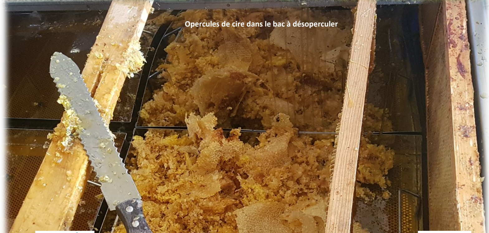
Opercules de cire dans le bac à désoperculer