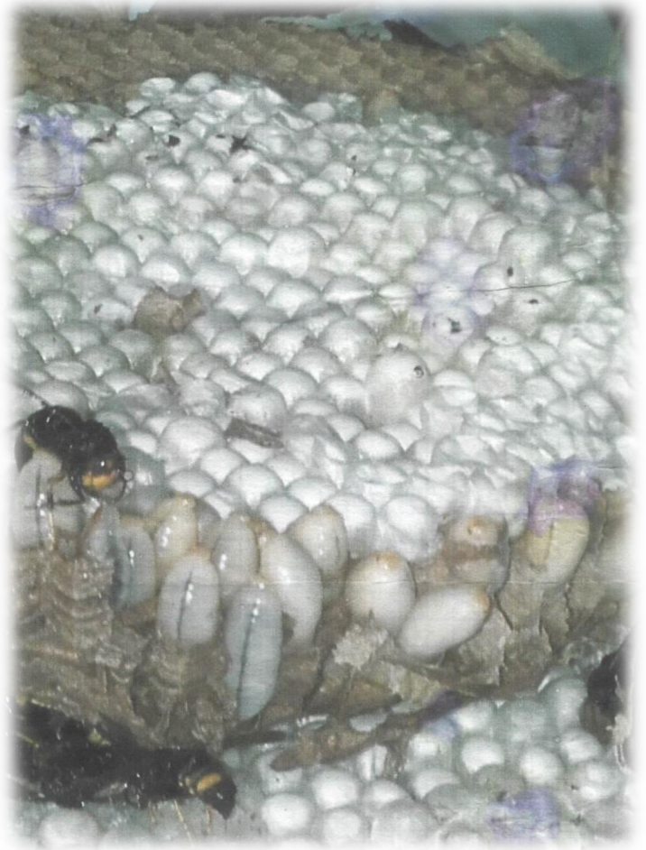
Larves de frelons