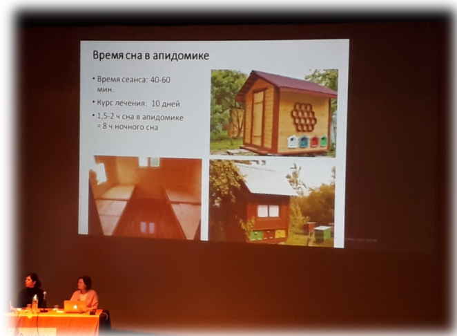
Mardi 11 et Mercredi 12 février 2020, journées d'études de l'A.N.E.R.C.E.A. à l'Agora de Boulazac.