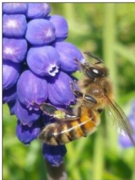
Arbres et arbustes mellifères et pollinifères permettent de nourrir les abeilles.

Victimes de leur succès, les commandes ont été partiellement réduites, pour satisfaire au mieux la totalité des 240 demandeurs. Trois points d'enlèvement étaient prévus, à la station de Tréllissac, à Meyrals et à Monbazillac. L'aide du conseil départemental