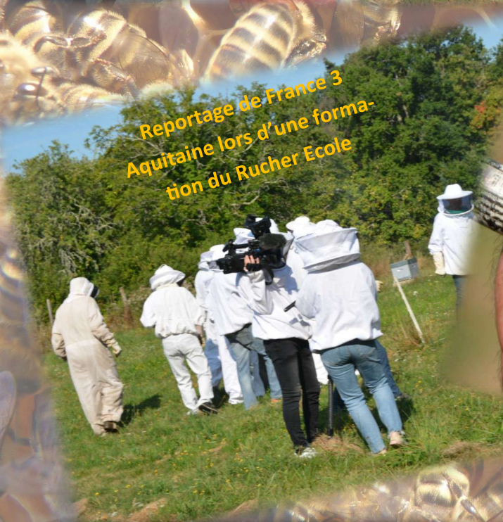
Reportage de France 3 Aquitaine lors d'une forma- tion du Rucher Ecole