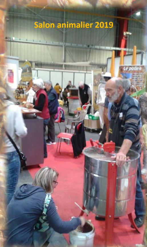
Salon animalier 2019