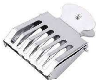
Pince à reine