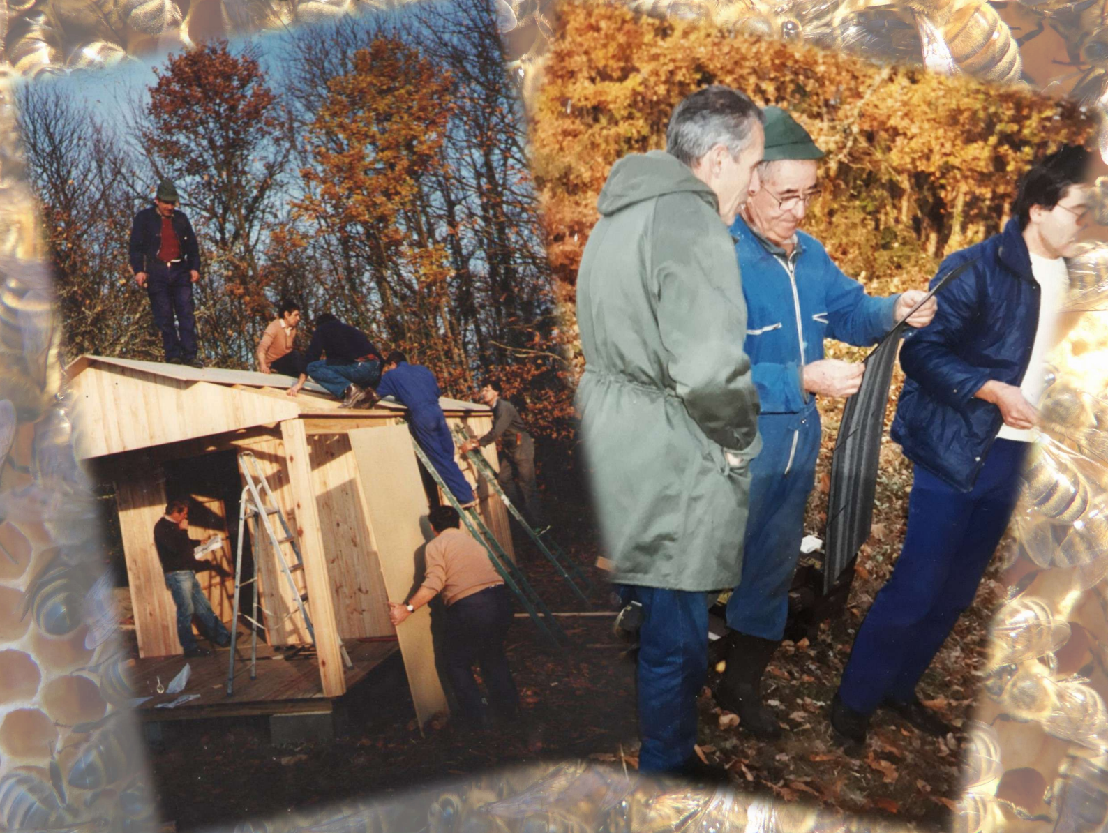
Montage de la première cabane à la station de la Gavinie en décembre 1989