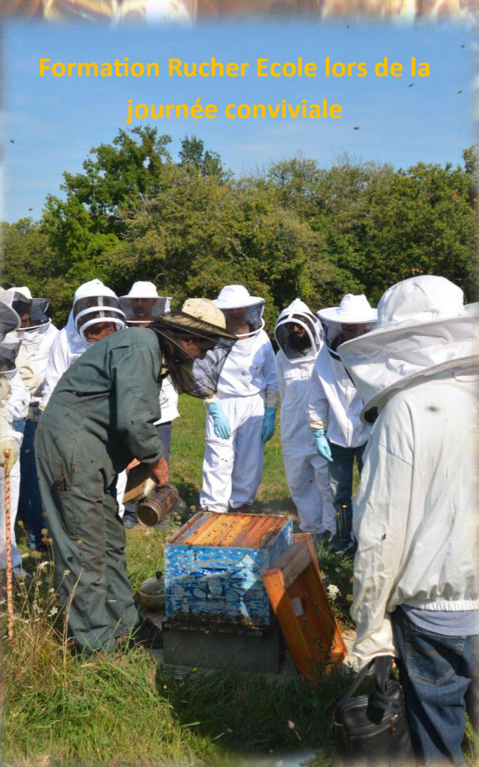
Formation Rucher Ecole lors de la journée conviviale