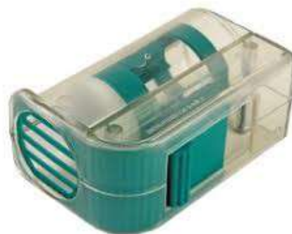
Les deux combinés en un

La reine est l'abeille qui commande toute une colonie d'abeilles. Elle a pour mission de pondre les œufs pour perpétuer la survie de la colonie.