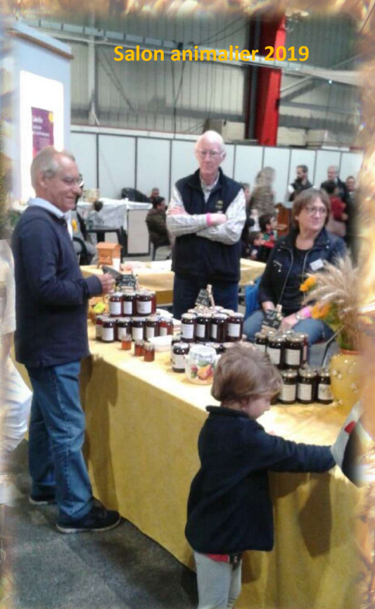
Salon animalier 2019